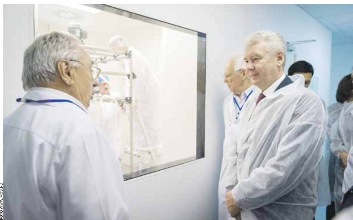
Сергей Собянин познакомился с работой компании «Пептоген»