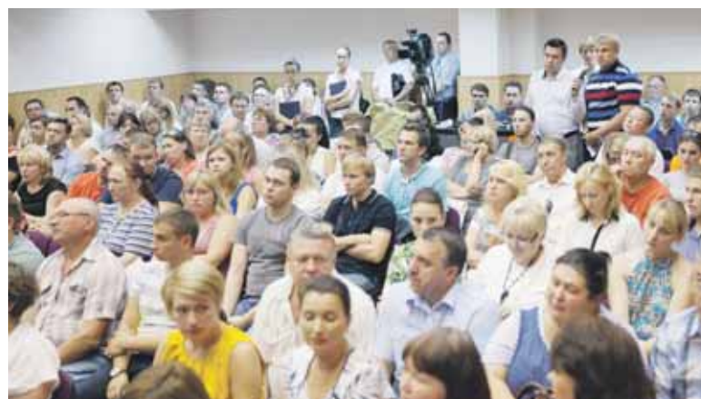
На встрече прозвучало много благодарностей от жителей