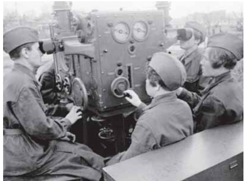
Зенитчицы Московской зоны ПВО у расчетного аппарата. 1941 г.

ки из Москвы, Сибири, с Урала, Кубани. Эшелоны с ними прибывали изо дня в день. В девичьем патриотизме нехватки не было, высшего и среднего образования для постижения новой военной науки тоже хватало. А вот физическая закалка и выносливость с мужской сравниться не могли. В замечательной послевоенной комедии «Крепкий орешек» москвичка-зенитчица Надя Орешкина, храбрец и молодец полутораметрового роста, стала собирательным образом всех юных патриотов, кто смог из нежных уголков девичьей сути извлечь неженскую силу, неженскую отвагу и женское великое