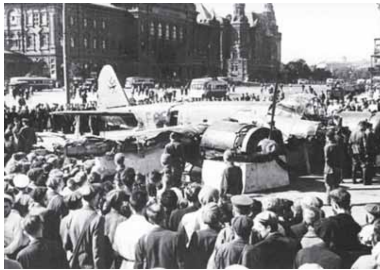
Жители столицы на площади Свердлова рассматривают сбитый немецкий самолет. Лето 1941 г.