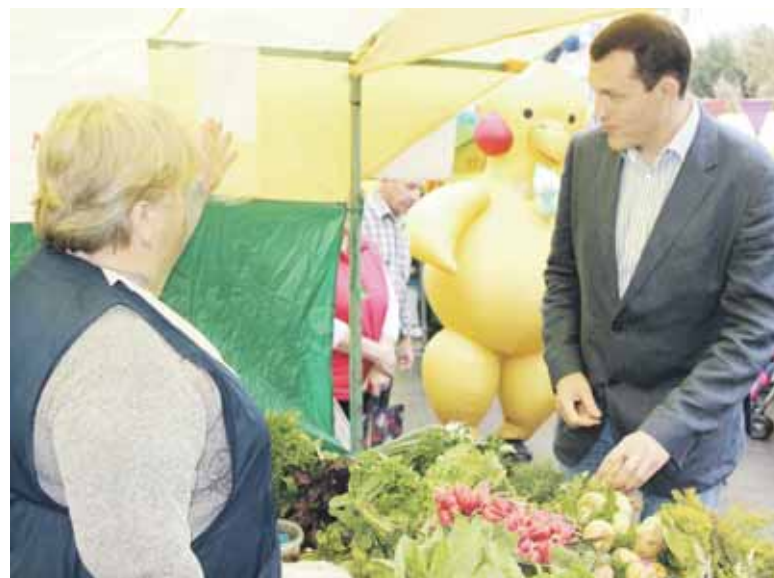
Префект округа Владимир Говердовский проинспектировал ярмарку выходного дня

В 2013 году в округе проведено более 350 ярмарочных мероприятий, из них ярмарок выходного дня – 338, региональных ярмарок – более 20. Ярмарки в округе посетили более 1,5 млн человек. Реализовано 3 тысячи 345 тонн продовольственной продукции.