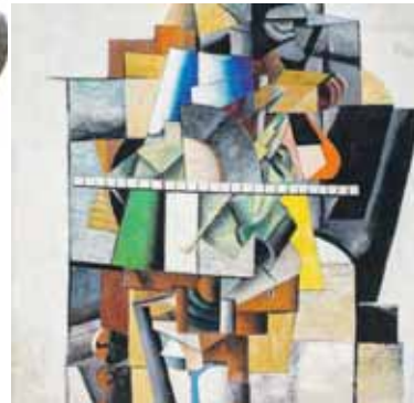
К.С. Малевич. Портрет М.В. Матюшина

Георгий Костаки – один из тех удивительных коллекционеров, кому удалось разглядеть гениальные произведения в вещах, которые современники считали «хламом». И благодаря своему провидческому дару Костаки сохранил для нас удивительные произведения авангарда и нонконформизма. Здесь Лентулов, Малевич, Филонов, Кандинский, Чекрыгин, Петров-Водкин и др. Костаки – первый коллекционер, который понял ценность искусства русского авангарда. Помимо этого он собрал коллекцию икон, которую перед отъездом из СССР передал в Музей древнерусского искусства им. А. Рублева. На выставке представлено более 200 экспонатов из легендарной коллекции «грека-чудака»: здесь иконы XV–XVIII вв., шедевры русского авангарда, творчество нонконформистов, народная и авторская игрушка.