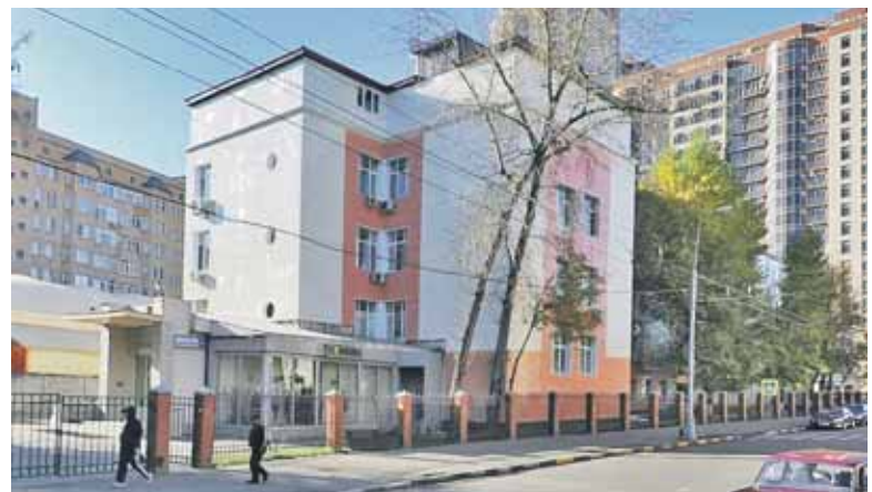
Современное состояние.

И мя Андре Люрса стоит в одном ряду с архитекторами-основоположниками «Интернационального стиля» во Франции. Для нашей страны Люрса особенно интересен как архитектор, «переболевший» коммунистическими идеями и решивший на практике воплотить свои представления о новой архитектуре в «красной столице».