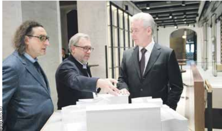
Художественный руководитель электротeatра «Станиславский» Борис Юхананов, мэр Москвы Сергей Собянин

«Театры Москвы находятся на пике своей популярности. В прошедшем году их посетили 4 миллиона 600 тысяч человек – это абсолютный рекорд за весь период театральной деятельности Москвы», – отметил мэр. Чтобы привлечь зрителей, необходимы новые форматы и технические возможности, поэтому ведется активная реконструкция театральных зданий за счет городского бюджета и частных средств. «В электротeatр «Станиславский», как он теперь называется, вложены сотни миллионов внебюджетных ресурсов – средств частных пред-