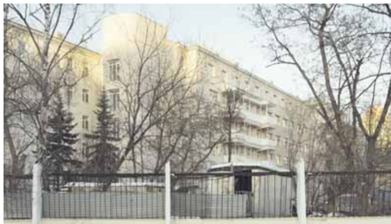
Натурное фото. 1960-е гг.