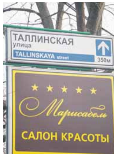
Фото с комментарием: назад в исконное!