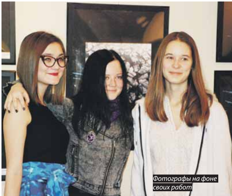
Фотографы на фоне своих работ

На празднике пройдет благотворительная акция от московского журнала «Мир интереснее, чем вам кажется!». Каждый гость получит журнал в подарок.