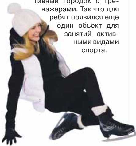
КОРОТКО О РАЗНОМ

Кроме того, в декабре прошлого года обслуживающая организация МПК «Северное Тушино» в рамках государственного контракта установила в парке по ул. Максимова детскую площадку и спортивный городок с тренажерами. Так что для ребят появился еще один объект для занятий активными видами спорта.